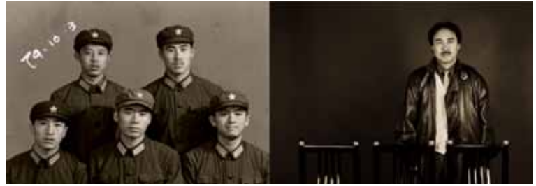
هم رقم ٣