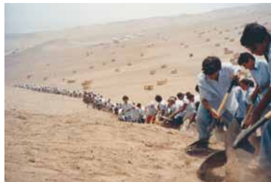
لقطة من «عندما يحرك الإيمان الجبال»

باعتقادك كيف يمكن لتنظيم ٥٠٠ متطوع لنقل هضبة مسافة ١٠ سم أن يكون تشبيه لثورة؟