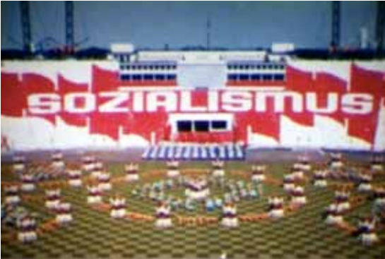
لقطة من «الماركسية اليوم (مقدمة)»

يُظهر فيديو فيل كولينز ثلاث مقابلات مع معلمات درّسن الماركسية - اللينينية في شرق ألمانيا قبل سقوط جدار برلين في عام ١٩٨٩. وذلك مثير للإهتمام إذ أن تغطية أخبار الثورات تارةً ما تركّز على الذين يحاولون التغيير السياسي وعلاقاتهم بمن في السلطة. أمّا هذا العمل فيركّز على تجارب الذين إستثمروا أيديولوجياً خلال النظام المهزوم.